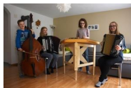
Kapelle Chlitalsträssler spielt!