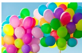
Attraktive Preise Ballon-Wettflug!