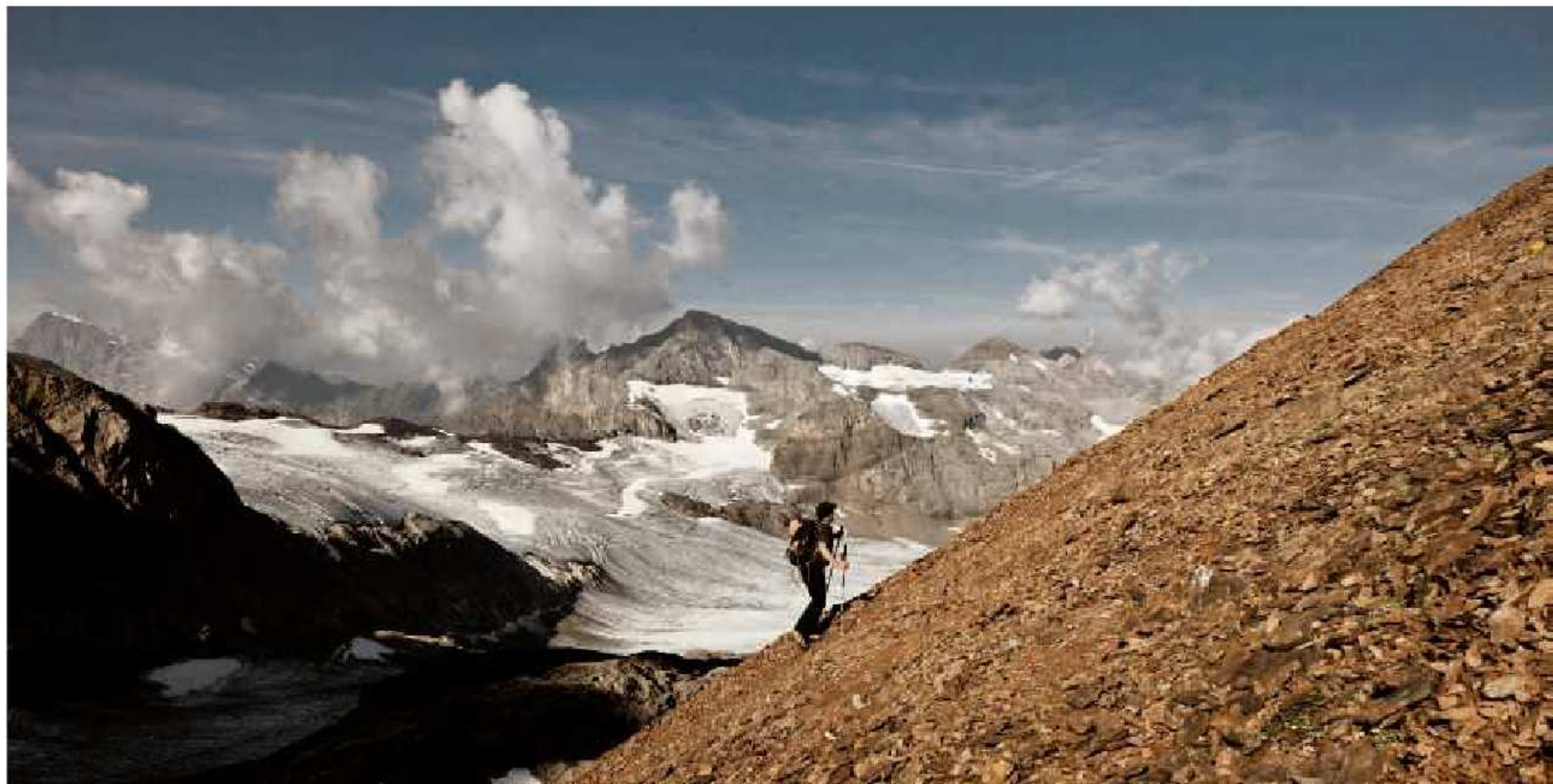
Das Panorama ist ein Gedicht: Aufstieg auf den Uri Rotstock mit Blick auf den Blüemlisalp und den Wissigstock (Mitte)