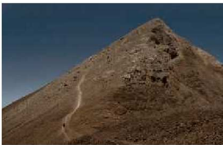
Zweitageswanderung: Gipfel des Uri Rotstock

Nach dem reizvollen Präludium in Isenthal angekommen, müssen wir uns entscheiden. Zwei Wege